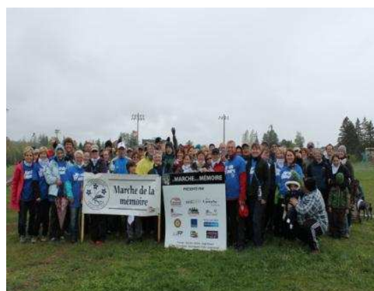
Malgré la température incertaine, plusieurs personnes se sont rassemblées pour venir soutenir les familles touchées par la maladie d'Alzheimer ainsi que les maladies apparentées.